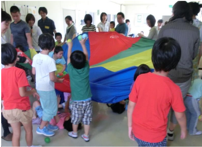
パラシュート (料理)